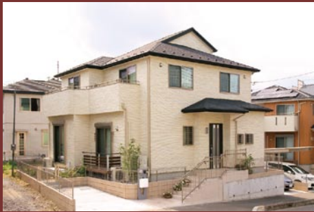
外壁にもこだわった存在感のある外観

ハイスタッドの天井が開放的な住空間を演出。無垢材のフローリングや建具をはじめ、ご家族で選んだこだわりの家具や内装のコーディネートも自慢のポイントです。