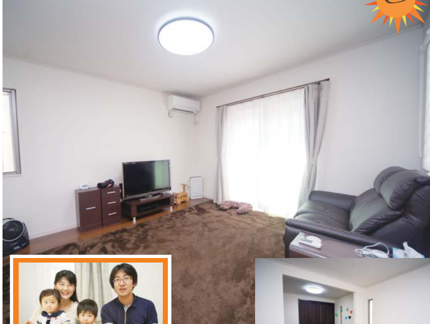
明るく落ち着いた上 質感あふれるリビング