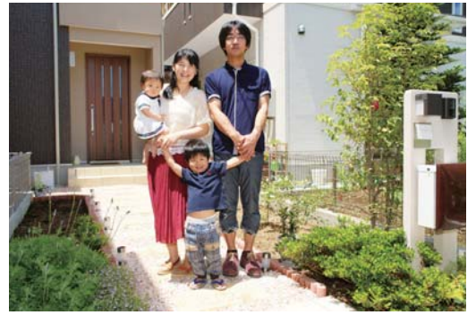
玄関前で見送ってくれたTさんご一家