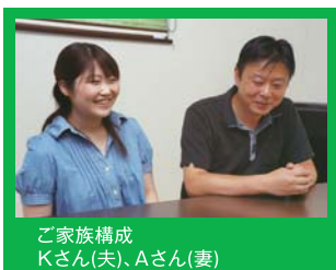
ご家族構成 Kさん(夫)、Aさん(妻)