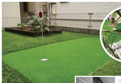
パットゴルフと家庭菜園のある庭