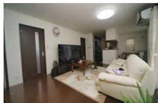
使いやすいリビング、ダイニング、キッチン

設計のときに希望したことは？ Kさん うちの場合は庭を重視していたので、まず庭の配置を決め、その後建物はどうするか決めました。設計の先生からも珍しいと言われたのですが、土地が北向きの角地なので日当たりなどを考えて工夫したつもりです。今は人工芝を張り、パットゴルフや家庭菜園を楽しんでいます。 Aさん 庭は対面式のキッチンから見えて菜園の様子などがわかります。家中は全体的に窓を多くして風通しをよくしました。明るくて気に入っています。 Kさん リビングにつながる洋風和室に掘りごたつを作ったのもこだわりです。家族や来客がここでくつろいでしゃべれたらいいと思います。窓は和紙のシェードで柔らかい光を取り込んでいます。 Aさん 夫はテレビや映画が好きなので大画面テレビの置けるリビングにし、天井には調光式の照明を付けて、映画館のような雰囲気をめざしました。 Kさん 庭と一階に時間をかけたので二階の設計はすばやく終わりました(笑)。