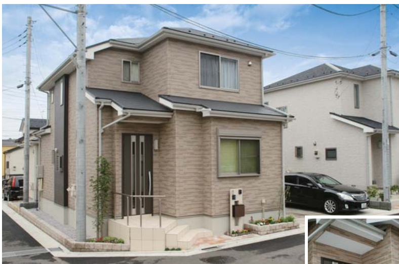
外観はブラウン系の落ち着いた雰囲気