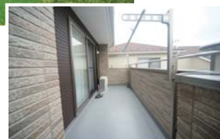
ゆとりのワイドバルコニー