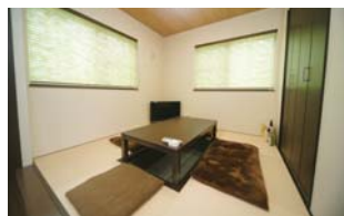
和と洋が融合したくつろぎの空間 掘りごたつでのおしゃべりが楽しい