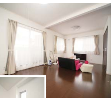
全体的に窓が多く明るく 風通しがよい