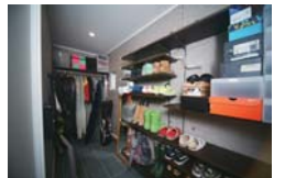
シューズインで玄関とキッチンが直結