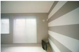
めずらしい横ボーター柄の壁紙