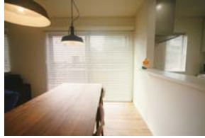
手づくりのウッドデッキ&フェンスで視界を演出