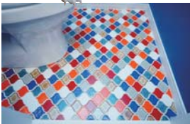
トイレのタイルは遊び心いっぱい